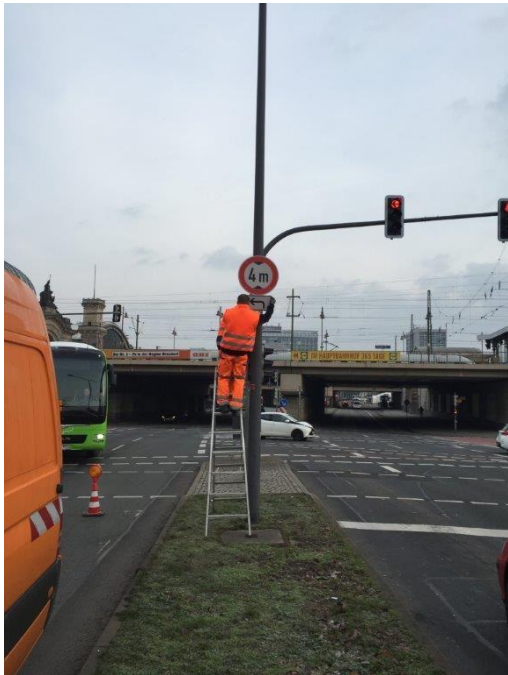
Bild 1 Mitarbeiter bei Turnustausch eines Verkehrszeichens

Mitarbeiter des Meisterbereiches Verkehrszeichenunterhaltung sind täglich im Stadtgebiet von Dresden unterwegs. Neben dem turnusmäßigen Wechsel von Verkehrszeichen, werden auch Vandalismusschäden, Schäden durch Verkehrsunfälle, Reinigungen, neue verkehrsrechtliche Anordnungen und alles andere was um das Verkehrszeichen zu tun ist, bearbeitet.