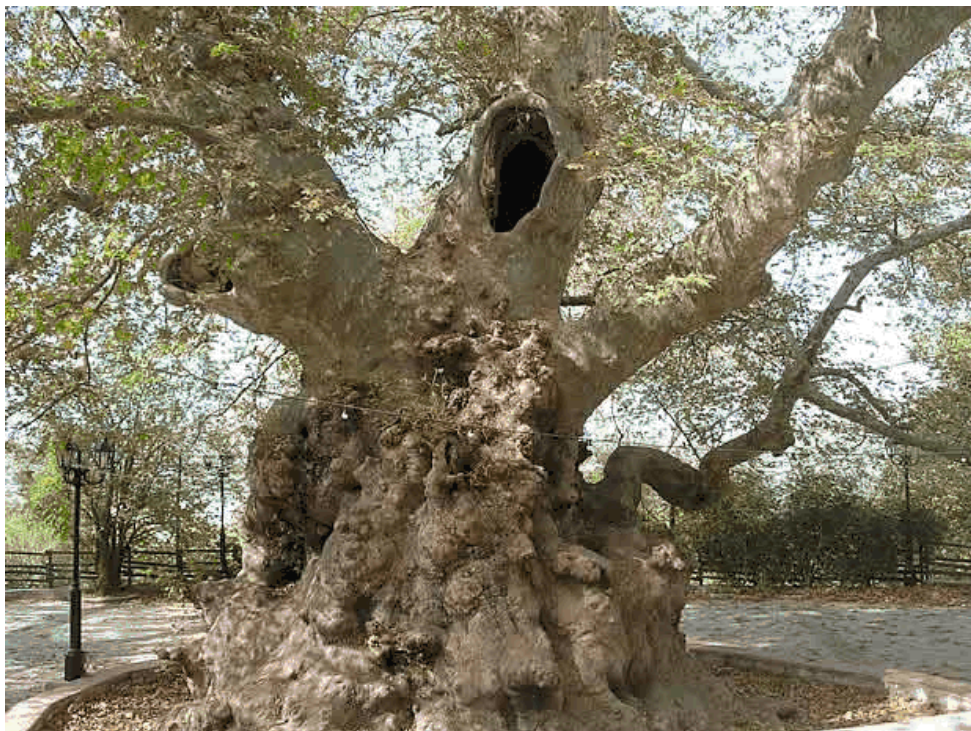
Die Platanen von Kreta

... das eine Eigenschaft der Platane, die in Deutschland eher als störend empfunden wird, der Wortschöpfung "Laube" zu Grunde liegt. Die Platane, hier oft auch als Straßenbaum verwendet, hält ihre Blätter sehr lange am Holz. Erst im späten Winter bzw. zeitigen Frühjahr sind die meisten Blätter herabgefallen und lassen erst dann das wunderbar starke Geäst dieses Baumes visuell zur Geltung kommen. In Griechenland hingegen wird diese Eigenschaft des sehr lang haftenden Laubes genutzt, um mit eben diesen belaubten Ästen die Dächer von Garten "laubten" abzudecken. (Quelle: http://rosengarten-dresden.de/index.php?id=226 )